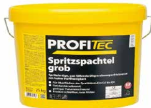
Gebindegröße: 25 kg