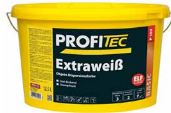
Gebindegröße: 15lt und 28 lt

Artikel-Nr. 28310 weiß 15lt Artikel-Nr. 29899 weiß 28lt